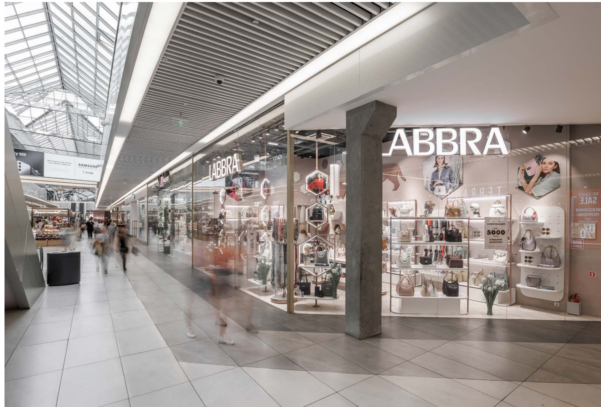
FORT Otradnoe Shopping Centre 15