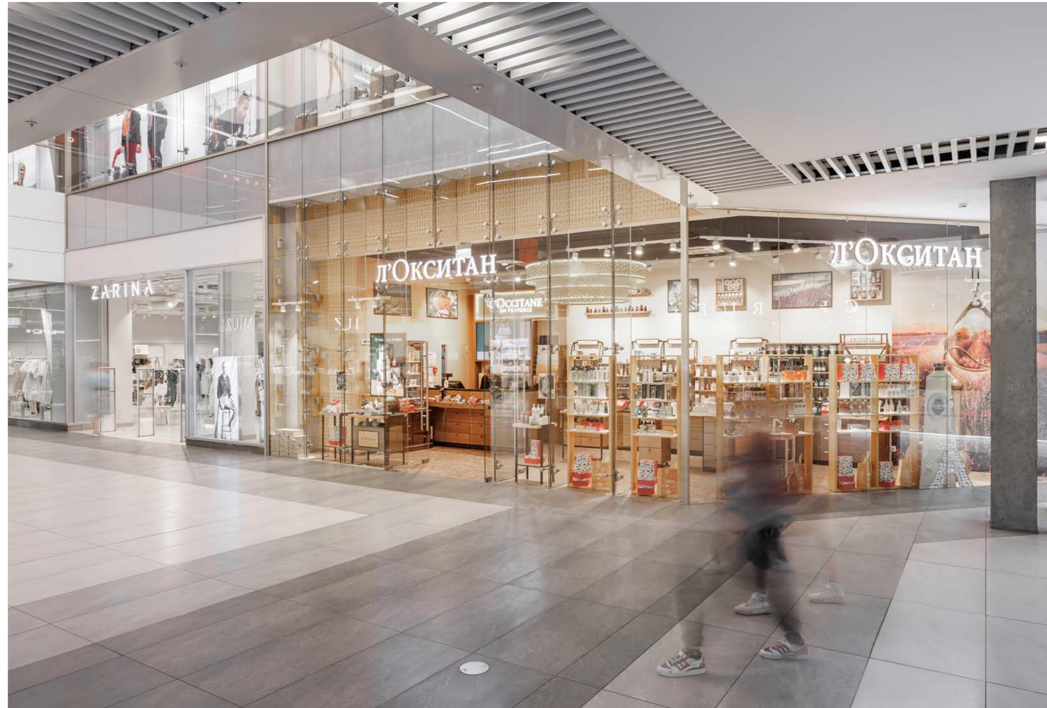
..... FORT Otradnoe Shopping Centre 11