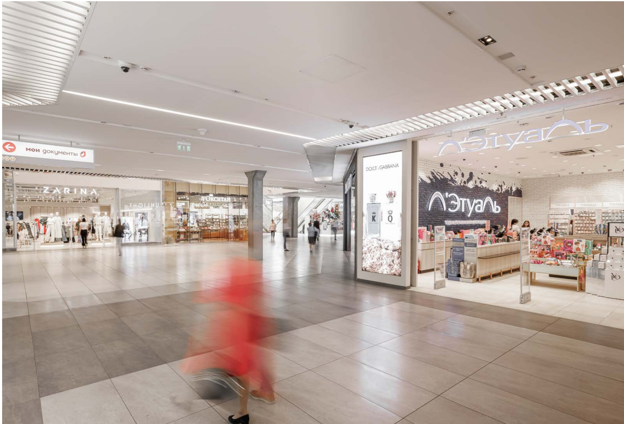
10 Торгово-развлекательный комплекс FORT Отрадное .....