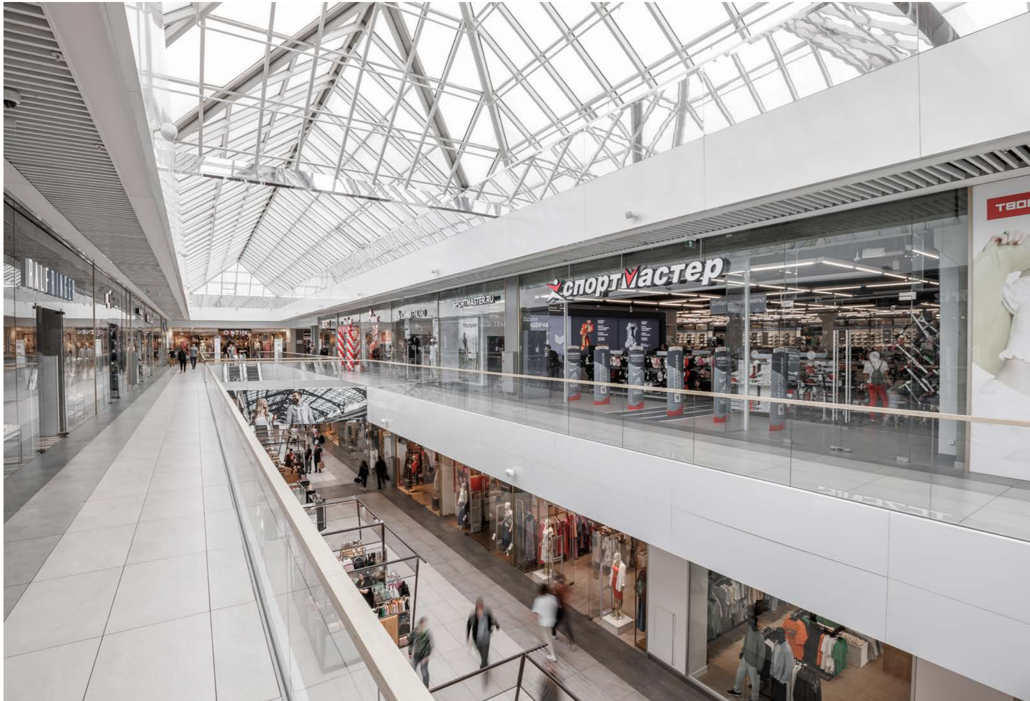
20 Торгово-развлекательный комплекс FORT Отрадное .....