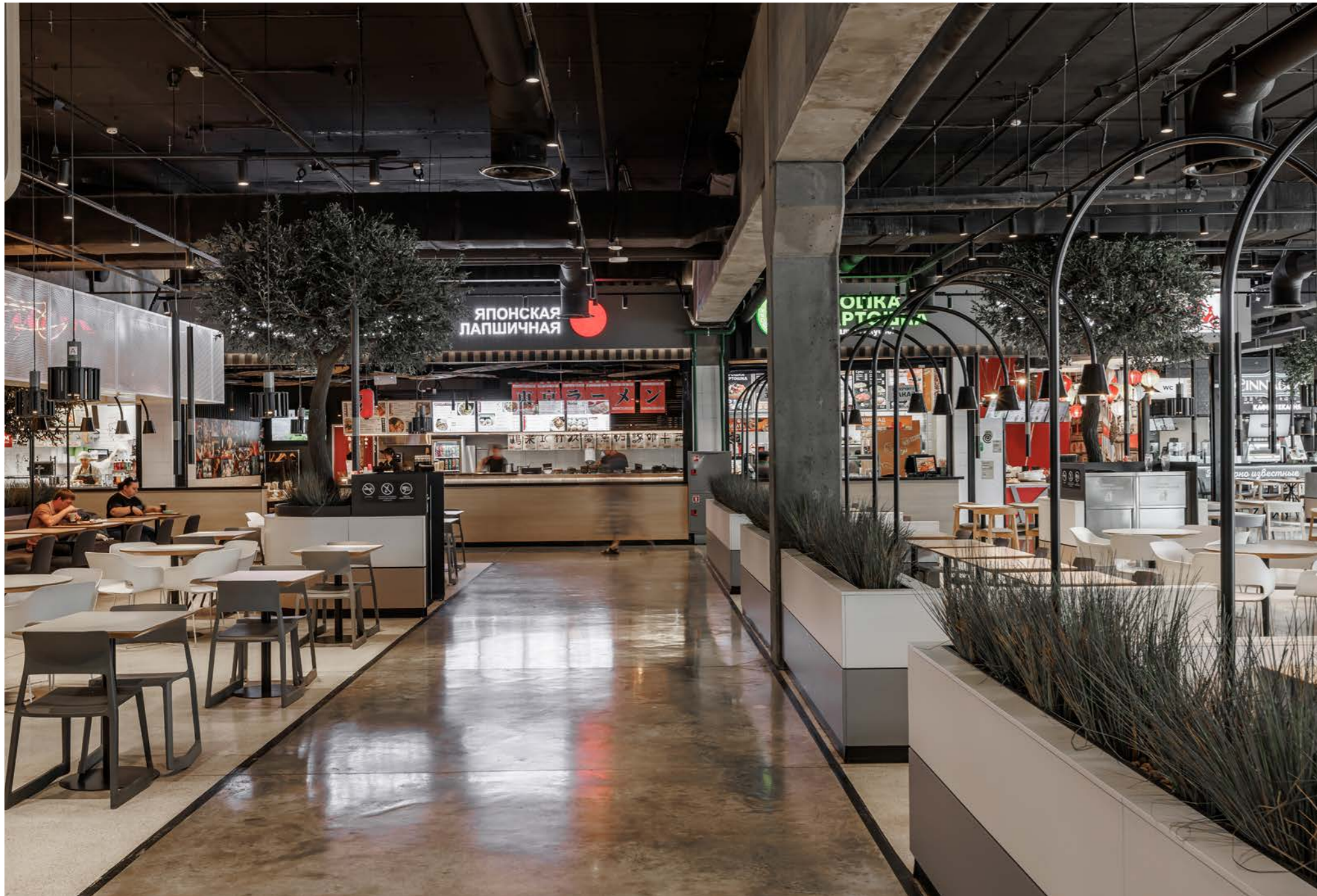
26 Торгово-развлекательный комплекс FORT Отрадное .....