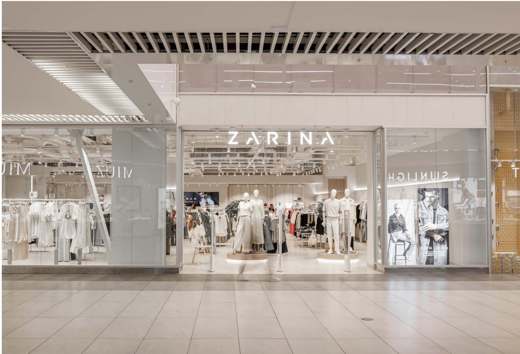
18 Торгово-развлекательный комплекс FORT Отрадное