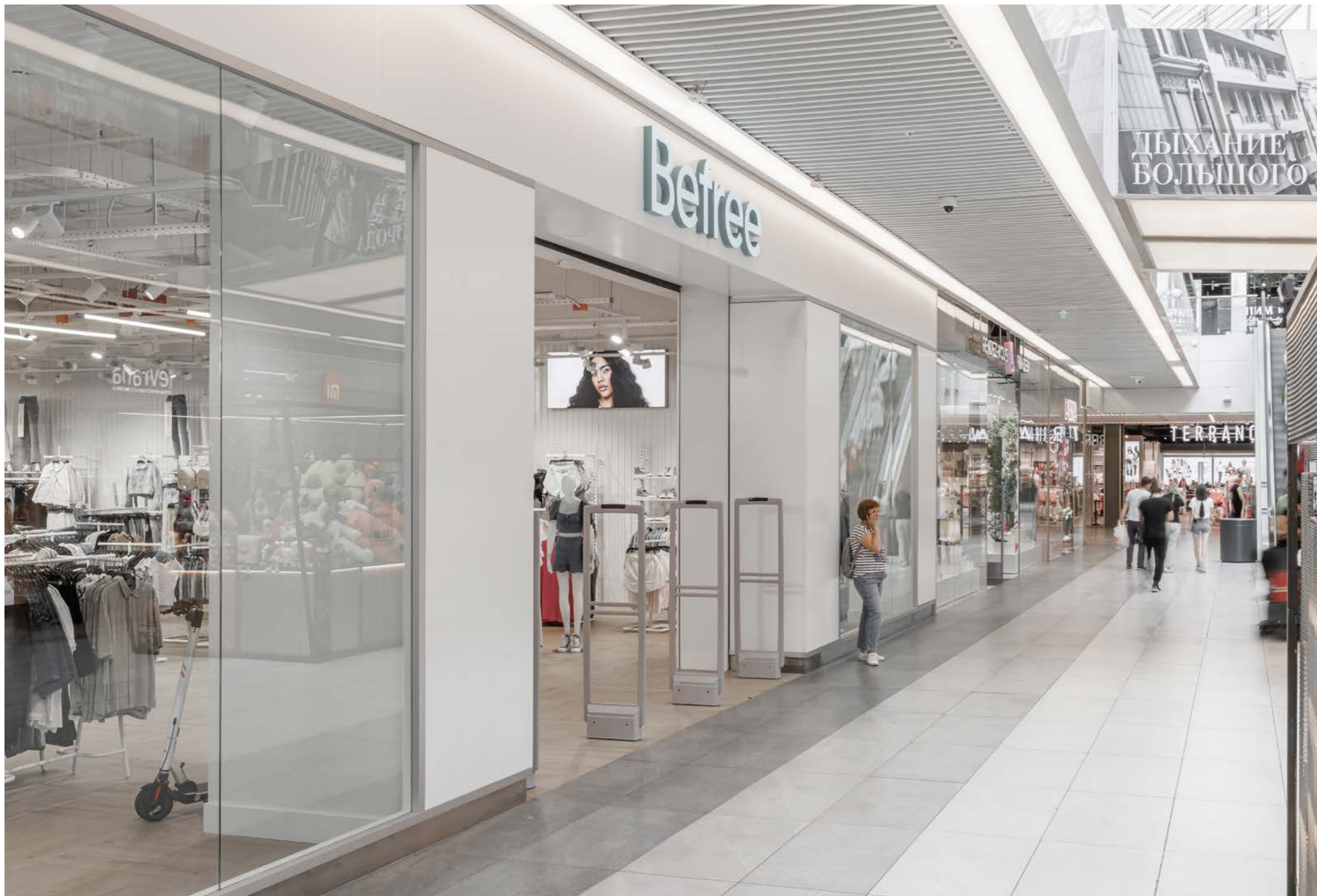
14 Торгово-развлекательный комплекс FORT Отрадное