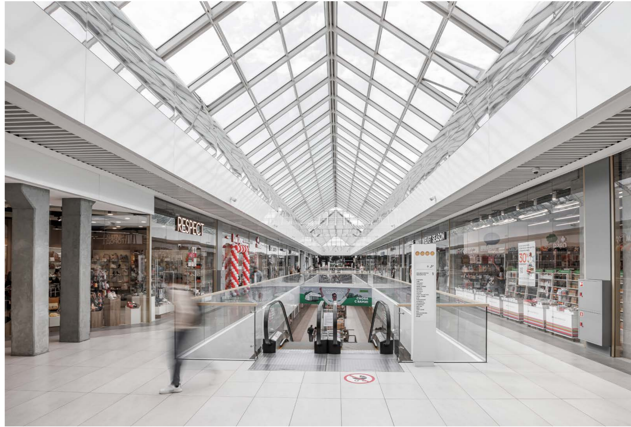
..... FORT Otradnoe Shopping Centre 21