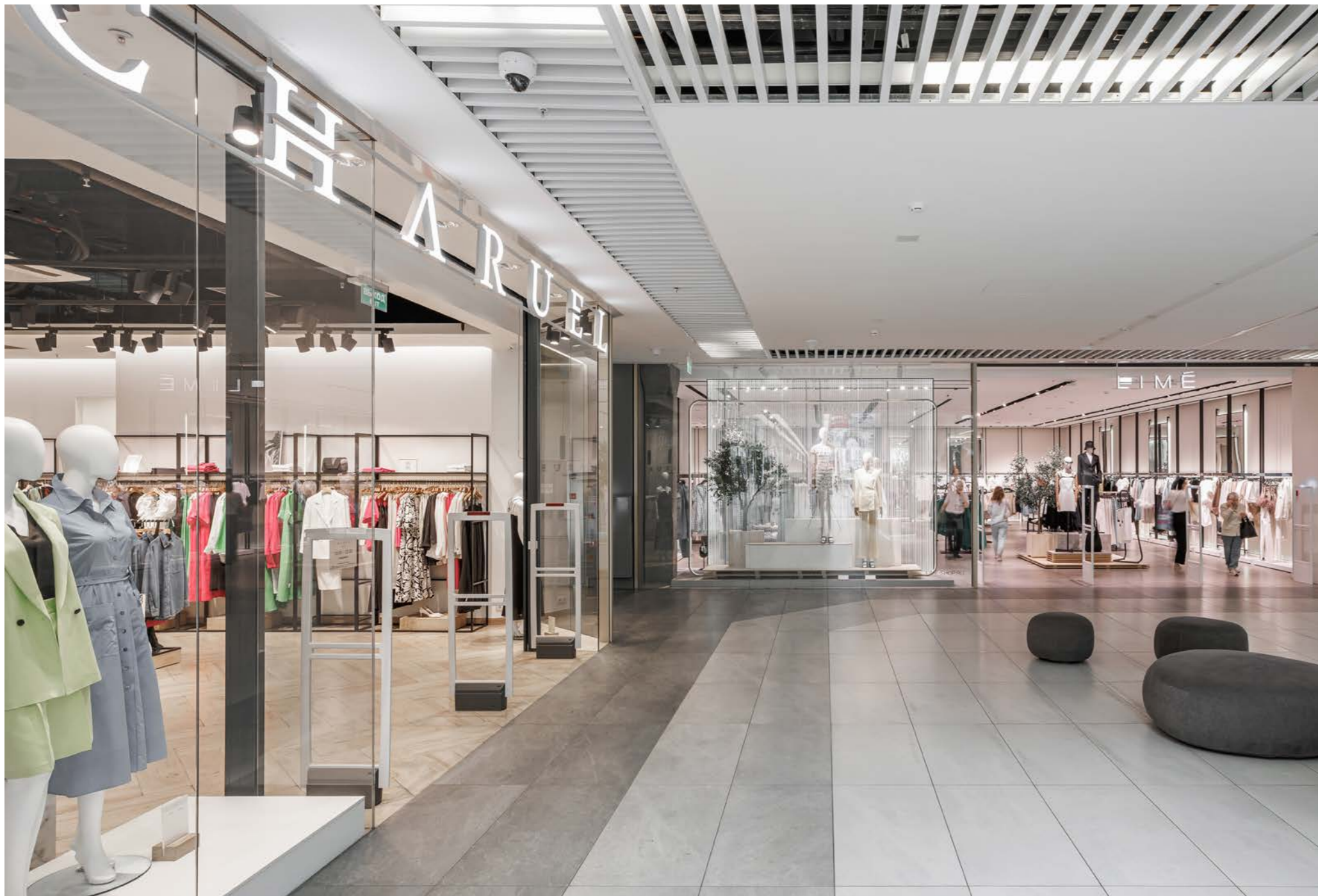
12 Торгово-развлекательный комплекс FORT Отрадное