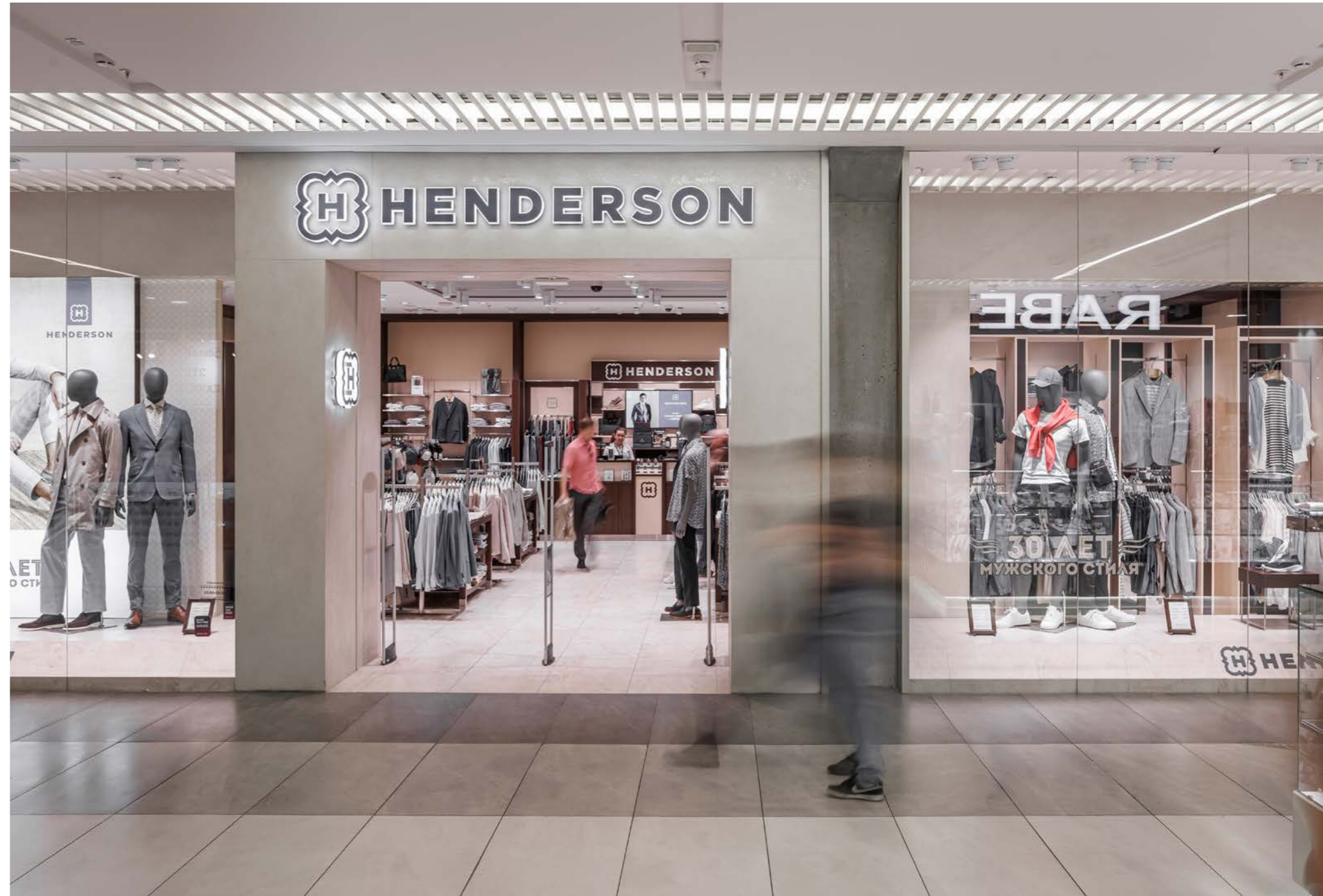
FORT Otradnoe Shopping Centre 19