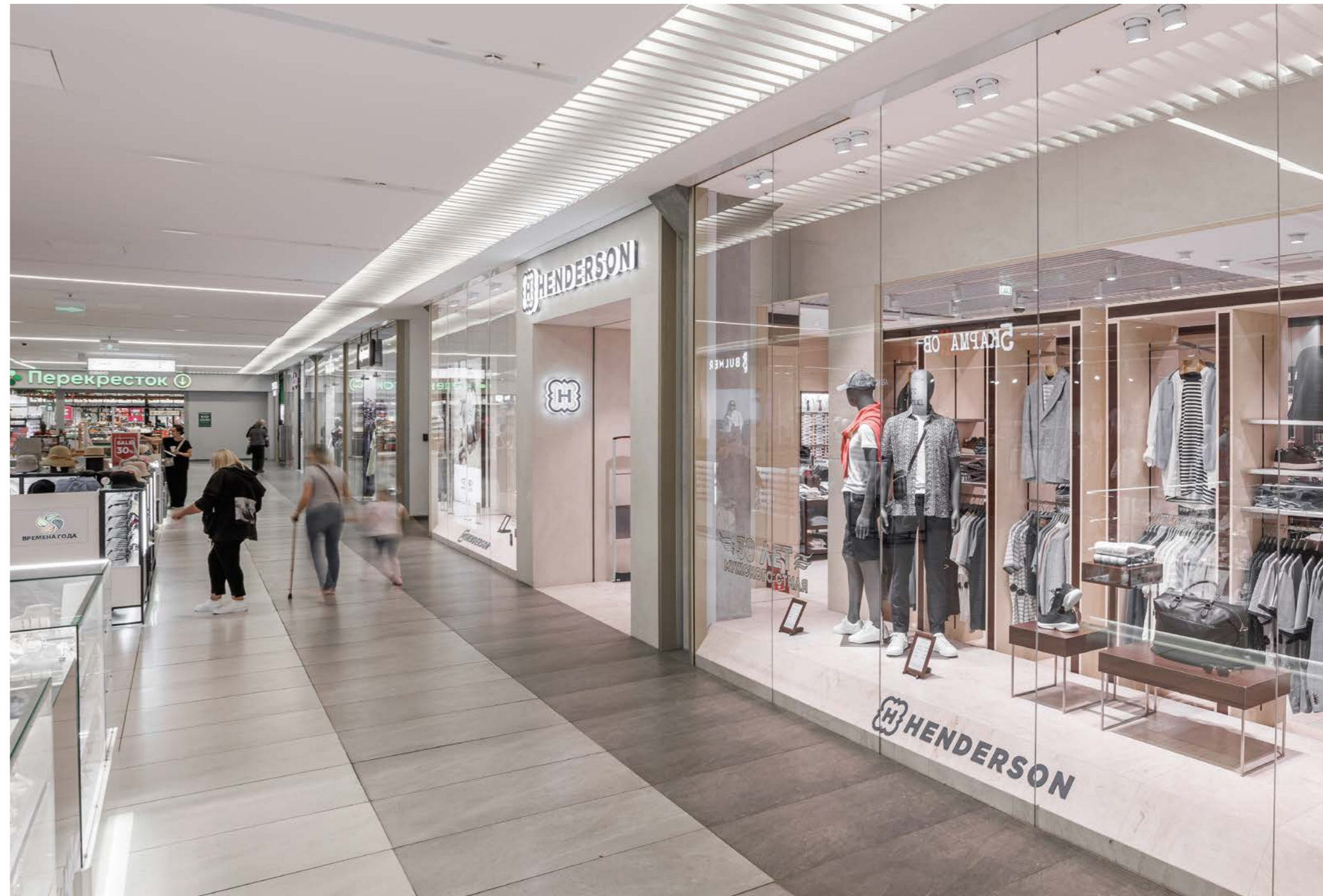
FORT Otradnoe Shopping Centre 13