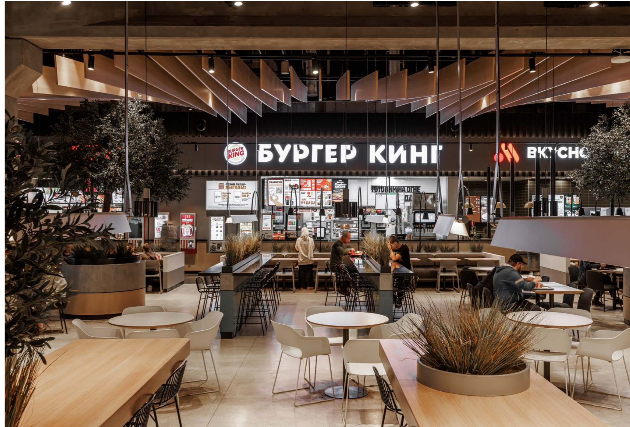
..... FORT Otradnoe Shopping Centre 27